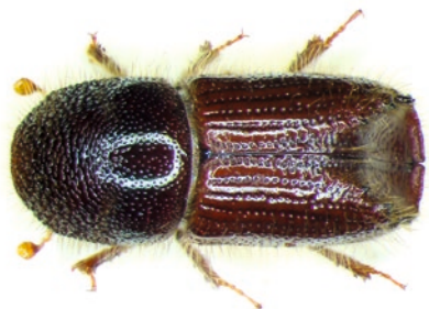
Dospělec lýkožrouta smrkového

Lýkožrout smrkový (cca 5 mm) napadá především čerstvě odumřelé dříví (polomy, vytěžené dříví v porostu nebo na skládkách), dále pak oslabené stojící stromy (např. suchem) a při přemnožení i zdravé stojící stromy. Vývoj probíhá pod kůrou na kmenech