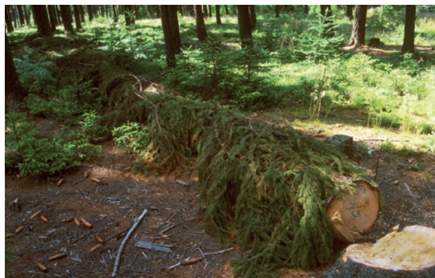
Lapák zakrytý větviemi

Lapák je pokácený a odvětvový strom, podložený (aby brouci mohli využít celou plochu kmene) a zpravidla zakrytý větviemi (zpomalení vysychání kůry). Kácí se před předpokládaným začátkem rojení, tj. zpravidla do konce března. Lapáky se musí kontrolovat, a to především z důvodu jejich obsazení, aby bylo možné včas přikácet další lapáky. Ty se přikacují, je-li lapák plně obsazen (cca 1 závrt na 1 dm 2 v nejhustěji napadené části kmene). Současně se kontroluje vývoj lýkožroutů, aby bylo možné lapáky včas asanovat.