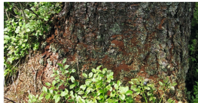
Drtinky na patě stojícího stromu

Na stojících stromech je prvním symptomem přítomnost drtinek na patě kmene. Na kmenech se objevují závrtky, doprovázené často výrony pryskyřice (pozor: v případě oslabení suchem k tomuto smolení často nedochází). Posléze dochází k barevným změnám jehličí, které postupně rezne a opadá. Dochází také k opadávání kůry, napřed na malých ploškách, později prakticky na celém kmene. Napadené stromy již nelze zachránit, je nutné je urychleně pokácet a následně asanovat. Na ležících stromech se nacházejí závrtkové otvory, vedle kterých se objevují hromádky rezavých drtinek.