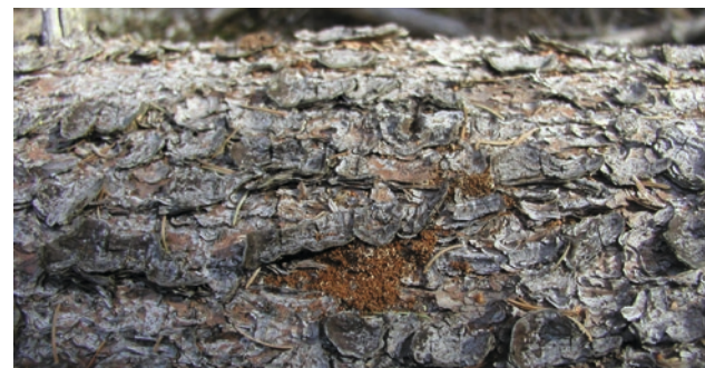
Drtinky na ležícím kmene