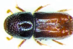
Dospělec lýkožrouta lesklého

se vyvíjí pod kůrou větví starých smrků, ve vrcholové části koruny nebo na mladých stromcích; na kmenech dospělých smrků ve střední a spodní části se vyskytuje méně často. Vývoj trvá 6 – 10 týdnů.