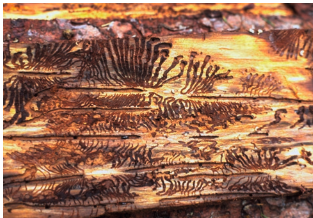
Rozvinutý požerek lýkožrouta smrkového

dospělých smrků s výjimkou jejich vrcholku (nejčastěji od stáří 60 let, výjimečně i mladších). Jeho vývoj trvá obvykle 6 – 10 týdnů, v závislosti na teplotě.