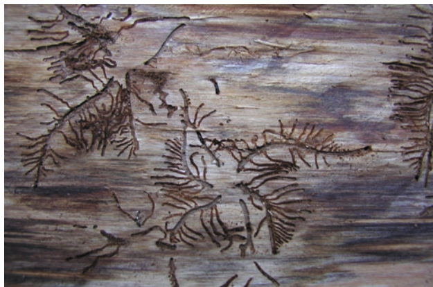
Požerek lýkožrouta lesklého